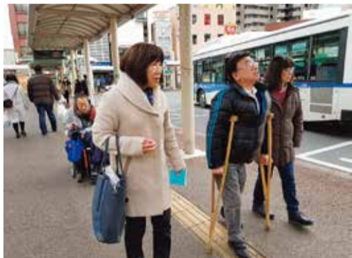
稲毛駅西口の点字ブロックを調査するあぐい議員