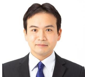
市議会議員(中央区) のじま友介

「住民こそ主人公」の市政を ご意見・ご要望をお寄せください 生活相談はいつでもどうぞ(日本共産党千葉市議団)